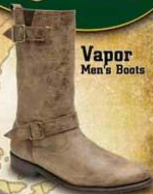
Vapor Men's Boots