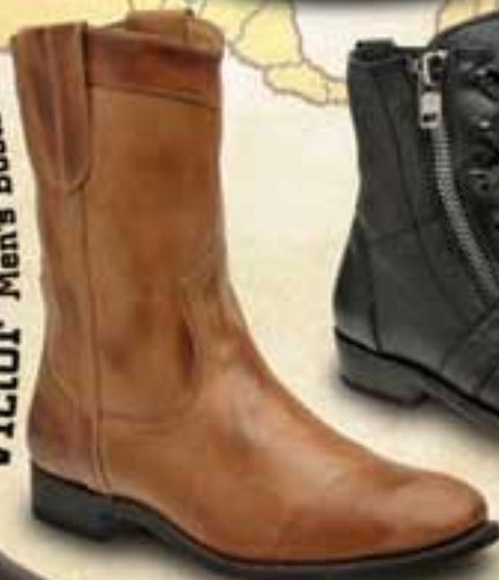
Victor Men's Boots