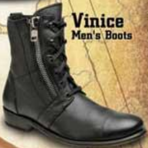
Vinice Men's Boots